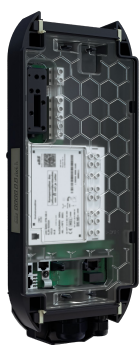
Montage mural avec eCLICK

L'eCLICK peut également être utilisé comme préparation à l'installation pour un clic ultérieur dans l'eBOX sans électricien.