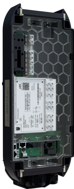
Montage mural avec eCLICK

L'eCLICK est la station d'accueil sur laquelle les eBOXes – smart, professional ou touch – peuvent être fixées. L'eCLICK peut être utilisé pour le montage mural ou dans l'ePOLE duo. L'installation de l'eCLICK doit être effectuée par un électricien spécialisé. L'installation ou le remplacement de l'eBOX peuvent être réalisés par l'utilisateur lui-même en cas de besoin.